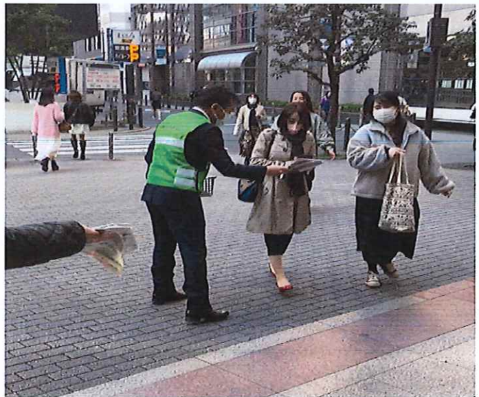
〈頒布品として一緒にセットいただいたポケットティッシュ〉